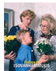
Isovanhempien päivän juliste